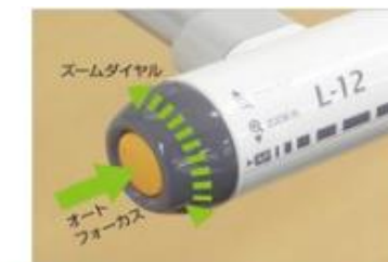
ズーム&フォーカス ボタンの操作