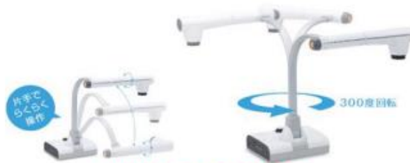
カメラレンズ部の可動部