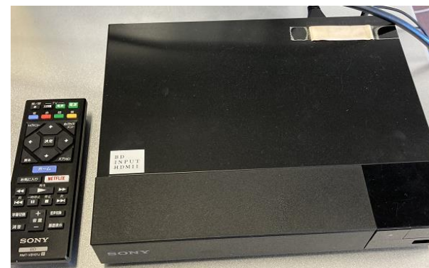
ブルーレイプレイヤー