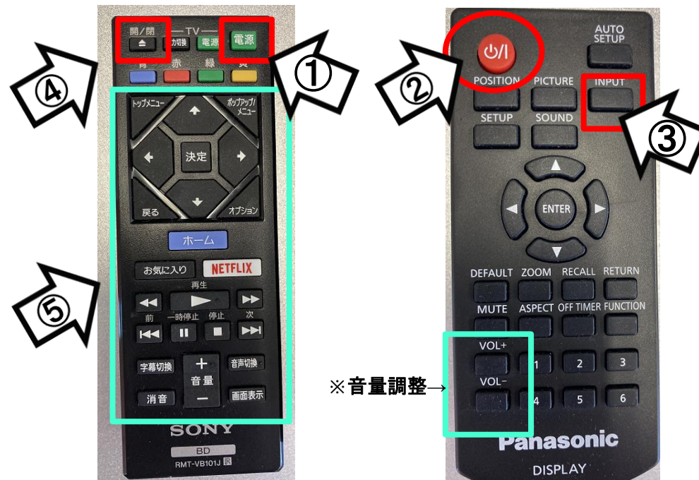
ブルーレイプレイヤーリモコン