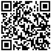
教室機器一覧ページ